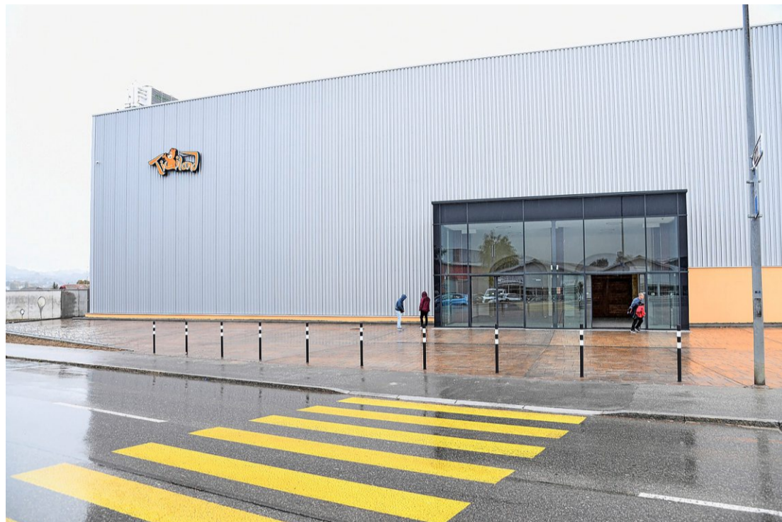
Das Ticiland ist von aussen unscheinbar: Bis Ostern soll ein Aussenbereich folgen.