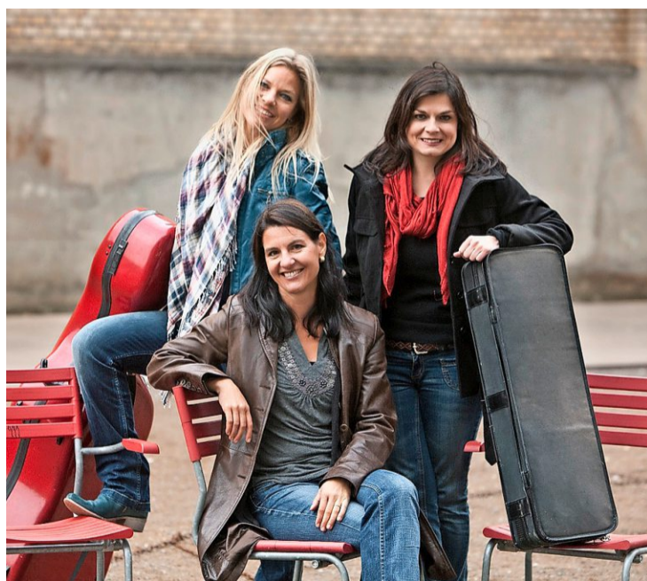
Das Trio Artemis reist nach Rheinau.